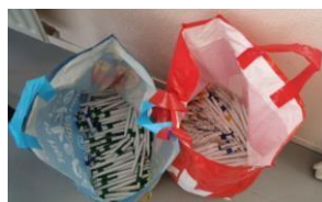
DK Accountants & Adviseurs