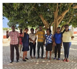
De school oogt binnen en buiten prachtig!